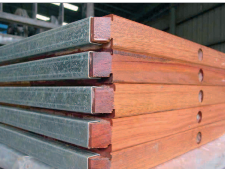
Hartholz-Unterlagsbretter von Antekad

Die ökologische und ökonomische Verantwortung nimmt Antekad schon lange wahr, beispielsweise durch den Anbau von mehr als 150.000 Hartholzbäumen, die in den letzten Jahren angepflanzt wurden. Dadurch, dass das Holz während des Aufwachsens überwacht und entsprechend gepflegt wird, leistet Antekad auch einen Beitrag zur örtlichen Wirtschaft. Ins-